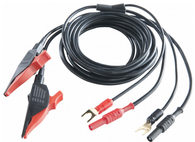
Kable pomiarowe z zaciskami Kelvina